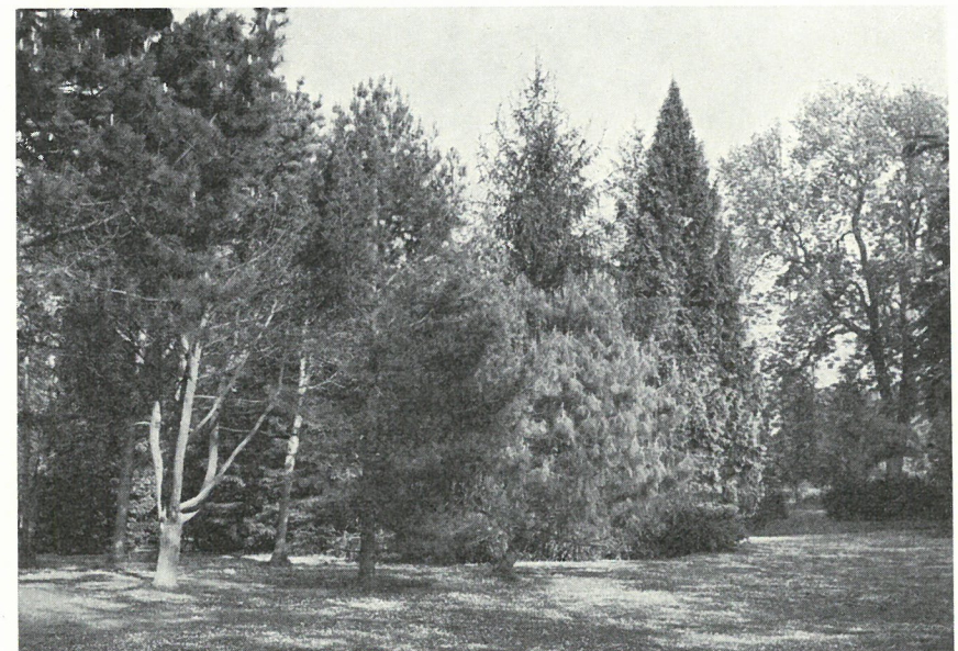
Parti fra Forsthaven, Århus

Særtryk af DANSK DENDROLOGISK ÅRSSKRIFT Bd. Hæfte III