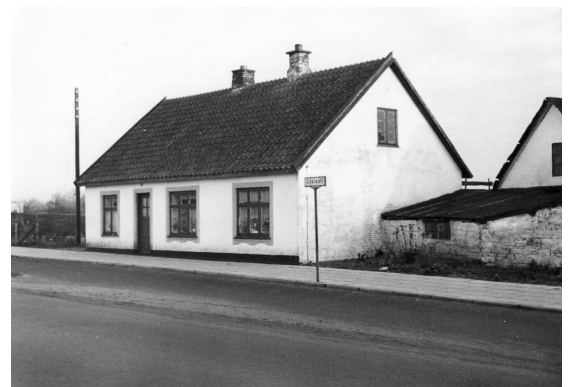
Koldingvej nr. 79 i Viborg