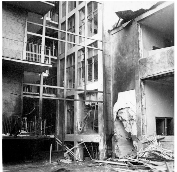
Aarhus Rådhus efter schalburgtageangreb i marts 1945.