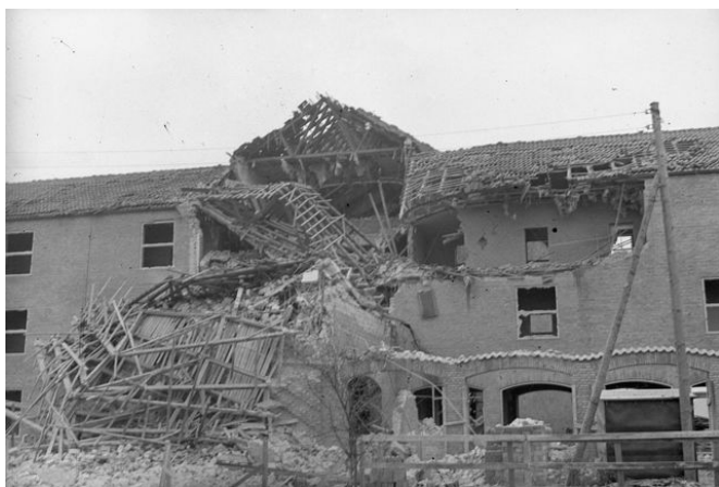
Aarhus Universitet efter englændernes bombardement af Gestapos hovedkvarter.