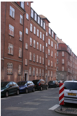
Lundbygsgade nr. 7

Jeg er født den 1. februar 1936 i Bülowsgade 40, Aarhus. Kort tid efter flyttede vi til en lejlighed på 2. sal i samme gade, nr. 72. Jeg husker den søde ekspeditrice i mejeriudsalget på hjørnet af Bülowsgade og Tietgens Plads. Jeg husker også den venlige mand, der ville hjælpe mig med at få min trehjulede cykel op ad trappen fra kælderen til gaden. Problemet var, at jeg syntes, jeg sagtens kunne klare det uden hjælp. Det kunne jeg ikke, så det kostede mig meget besvær at nå mit mål.