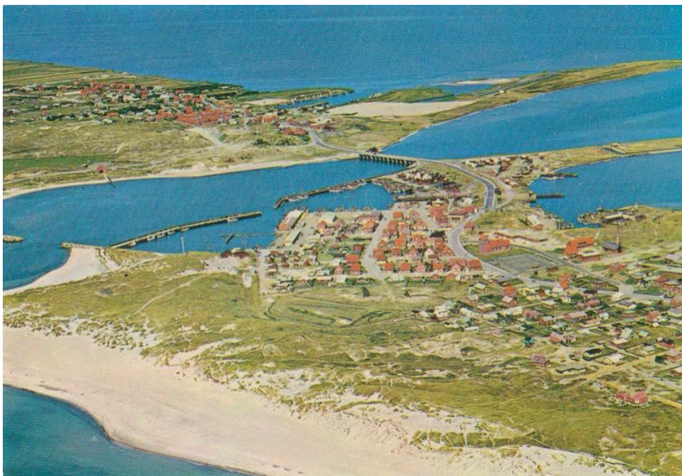
Luftfoto af Hvide Sande.