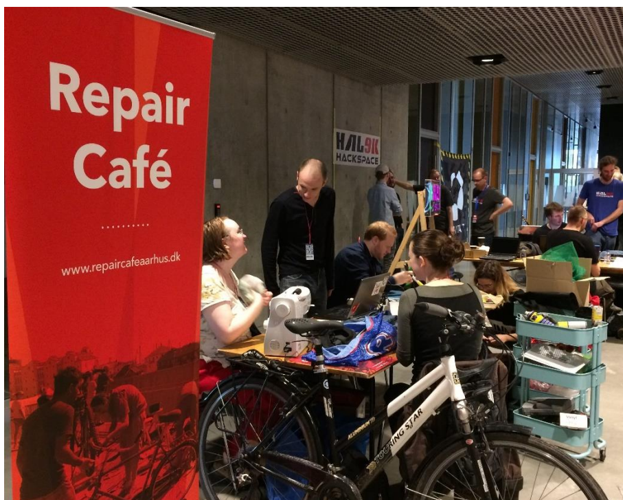
Repair Café Aarhus deltog i dette års Aarhus Mini Maker Faire.

Jeg tænker på det som en storby, hvor du kan gøre masser af ting, men stadig har en høj livskvalitet. Det er ikke en hovedstad, så alle er ikke så travle. Den er stadig i "menneskehøjde", så den har midlerne til at gøre gode ting. Jeg kan virkelig godt lide det på den måde. Den har bare den rigtige størrelse; du kan organisere en international konference og stadig have gode mennesker der, men det er ikke sådan, at de siger: " Åh, jeg har ikke tid, jeg skal mødes med statsministeren! ".